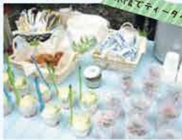
手作りのドーナツやフルーツなど用意していただきました。