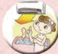
一番お手軽浴室暖房乾燥機