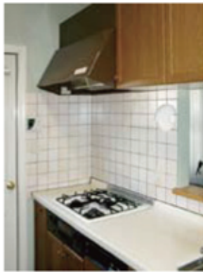
17年間ごころうさまでした。

今回のお客さまは、1様邸です。新築から17年、テレビCMで大手ガス会社のコンロリースを見て、ビルトインコンロの交換を考えておられた1様から、コンロリースをしている当社にご連絡を頂きました。さっそく1様邸を訪問したところ、話題は17年間使われた換気扇に…。長いこと使われた換気扇は油でベトベト、そこにゴミが付着して汚れていました。そこで今回は、油污れもすぐに落ちる新塗装品の換気扇をご提案させて頂きました。