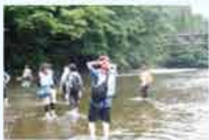
ガイドさんの説明と軽いストレッチをしてレッツゴー!

残暑厳しい中、涼を求めて思い立ったのが川遊び。広報はんのうを見たら、「大人の川時間」とか「リバーウォーク」とか気になる記事が・・・♪ さっそく体験をしにでかけてみました。