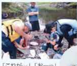
「これが…」「おーっ」川の生き物勉強会。