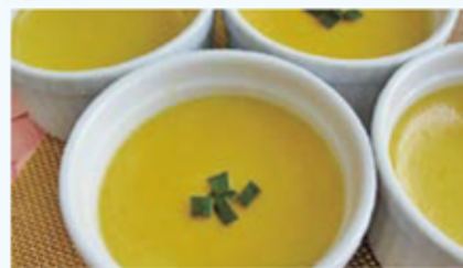
かぼちゃの皮を飾りに♡