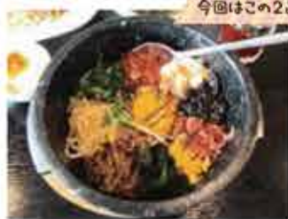
人気セットの石焼ピビンバ