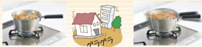
地震で火が自動にストップ!!

調理中でも素早く地震に対応してくれる「感震停止」機能。機器本体が震度4以上の揺れを感知すると、自動的にガスを消火する機能です。