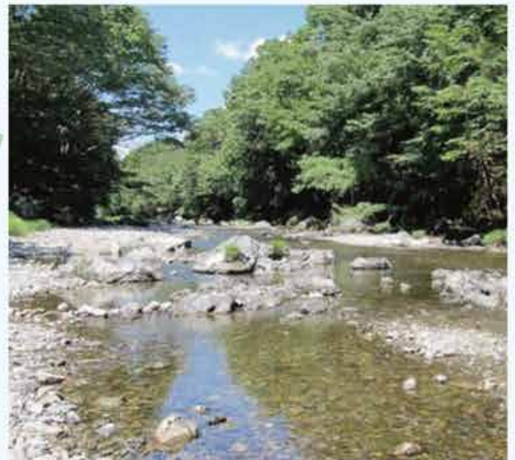
ガイドさんに昔の名栗川の様子や西川材の説明もしていただきました。スタッフの皆さんの親しみのある笑顔が印象的な川時間でした。

今回の体験ツアーは飯能市エコツーリズム推進協議会主催 飯能リバーウォーク〜大人の時間〜です。これからのエコツアーも楽しみだな。詳しくはHPから http://www.hanno-eco.com