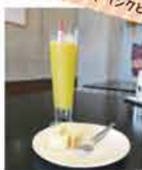
今日のデザートはロールケーキでした。