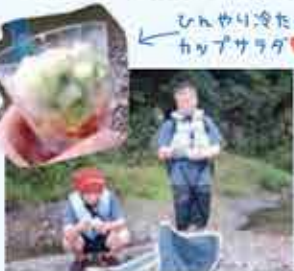
川のせせらぎをBGMに「うまいっ!!」「ですね!」