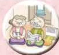
空気を汚さないファンコンベクター

ご存じでしょうか?エネファームやエコウィルなど最先端のシステムじゃなくても暖房付ふろ給湯器1台でお風呂や給湯そして温水暖房の熱源としてご利用いただけることを。