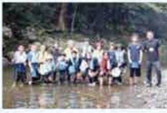
参加者とスタッフの皆さんで思い出の一枚。