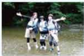
何年かぶりに入った水の中は冷たくて気持ちいい〜。