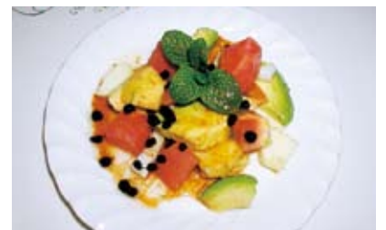
アボカド、トマト、セロリ、ドライブルーベリー、ミント、しょうゆドレッシング

●近頃はまっているのがアボカドのサラダ。アボカドは皮がこげ茶色になって押してみてもやわらかい感じがしたら食べごろ。間違えるとおいしくありません。マグロのトロのような味で病みつきになります。