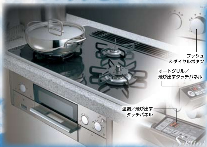
プッシュ &ダイヤルボタン オートグリル/ 飛び出すタッチパネル 温調/飛び出す タッチパネル

感性を刺激する ニュー・スタイル。 洗練された操作性と 先進の機能、 次世代型 ビルトインコンロ。