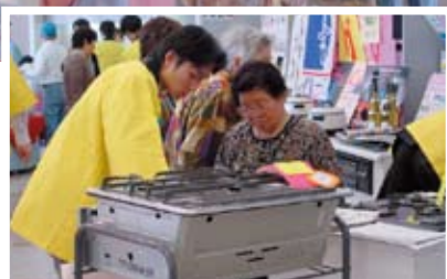
当社ショールーム