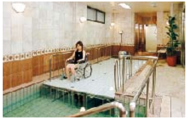
リハビリに最適な水治療室