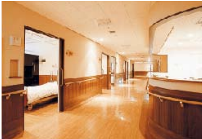
屋光色の間接照明を取り入れた「夕方色」の廊下